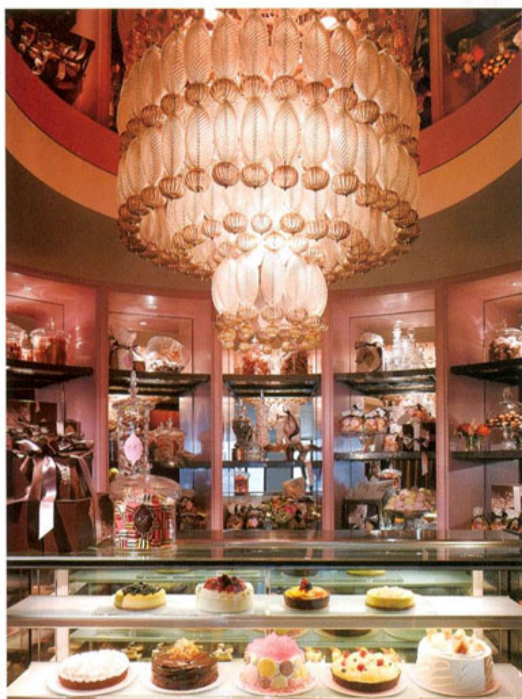
餐厅开业的第一年间，共售出7,388个「原创香脆蛋糕」(Original Crunch Cake)